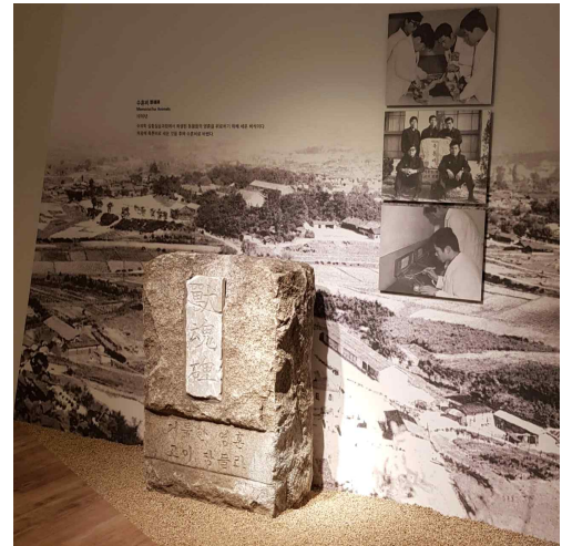
<역사관 수훈비 전시>