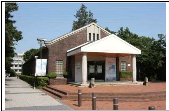
< 박물관 전경 >

서울시립대학교 박물관은 소중한 문화유산을 수집·전시하여 학생들의 교육활동을 지원하고, 시민들을 위한 문화공간으로 기능하기 위하여, 1984년 9월 4일에 개관하였다. 특히 서울시립대학교 박물관은 근현대 전문 박물관으로서 서울의 도시화 과정을 보여주는 자료의 수집과 전시를 전문으로 한다. 서울의 역사와 문화를 담은 특별전 개최, 조사연구, 유물수집 등을 통하여 학생 및 시민들에게 수준 높은 문화 서비스를 제공하고 있다.